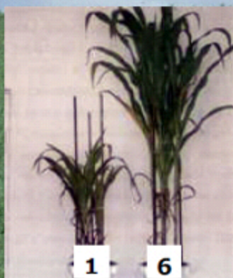
Wpływ nawozu ZÓWAN na wzrost kukurydzy: 1 – kontrola bez nawożenia; 6 – ZÓWAN 200g